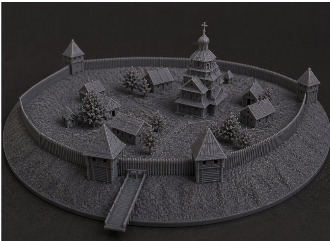
Рисунок 2. Модель, напечатанная на 3D-принтере