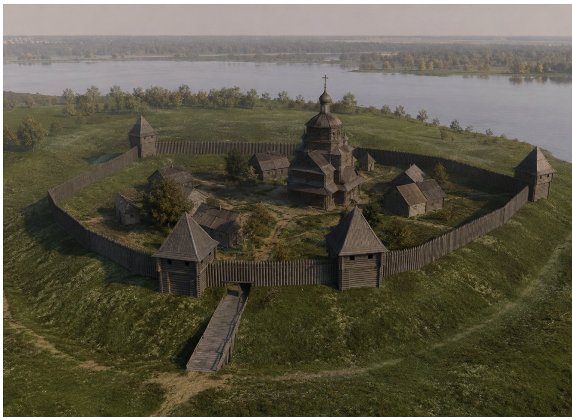
Рисунок 3. Визуализация модели в редакторе