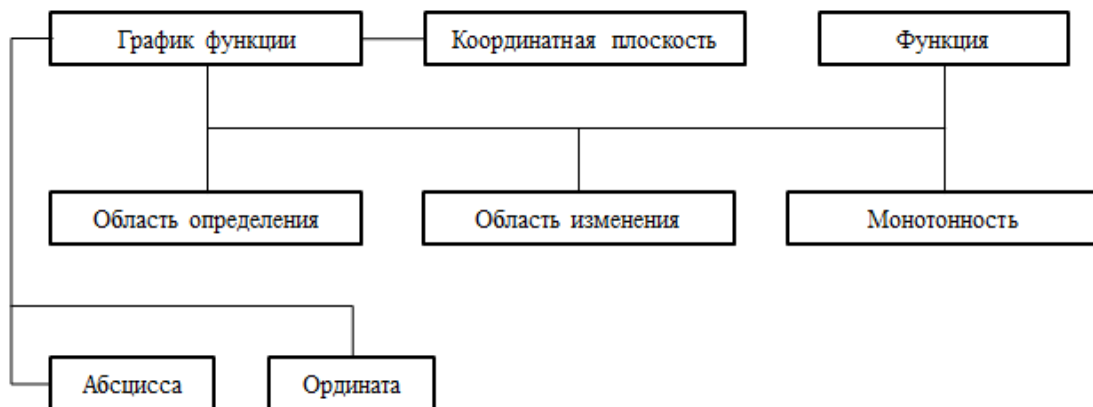
Рисунок 2. Пример семантического графа модуля знаний

Чёткая система контроля в модульном представлении знаний может быть обеспечена на основе компьютерного тестирования. В каждом модуле при этом допускается промежуточное тестирование. Происходит реализация итогового контроля для всех мо-